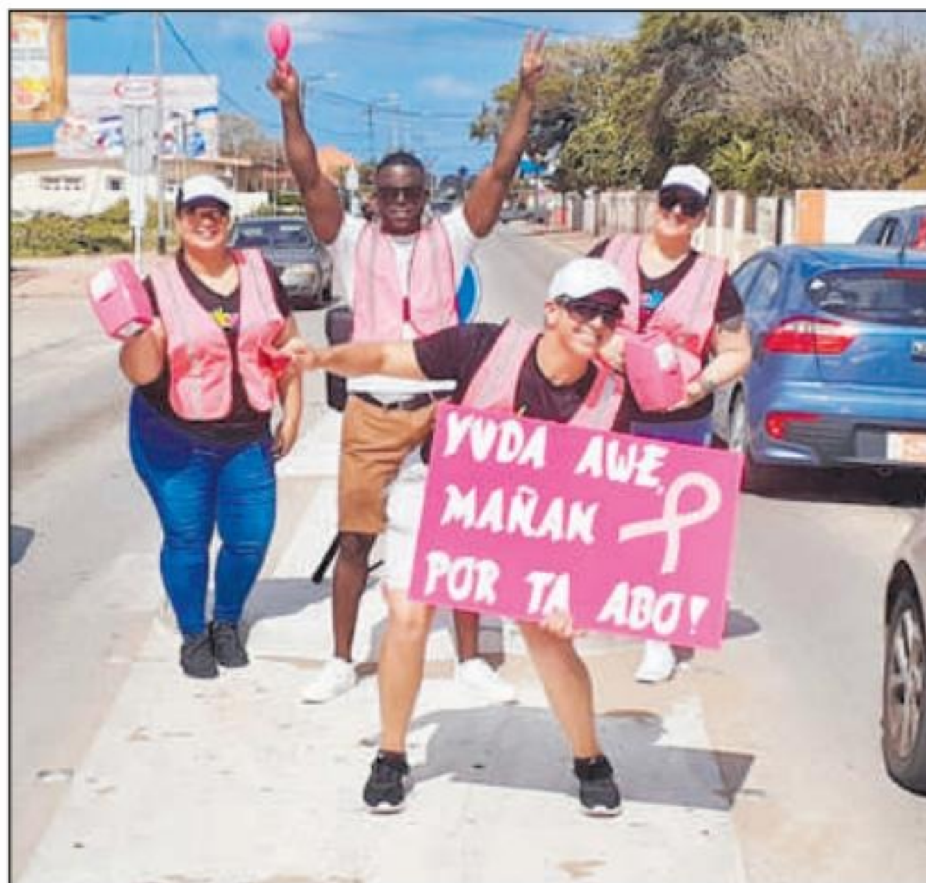
tambe cu e fundacion ta colecta fondo na diferente punto rond